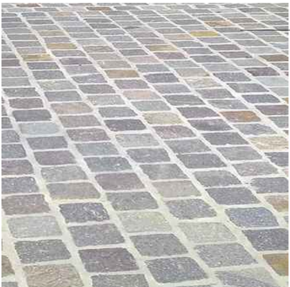
Pavimentazione in porfido